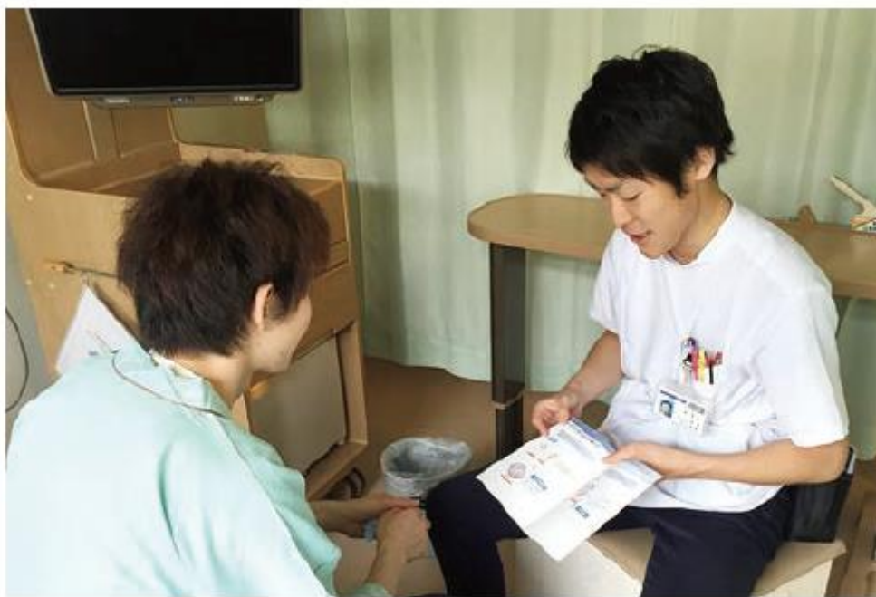
病棟薬剤師による服薬指導