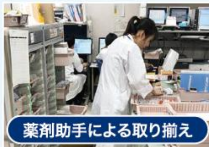
薬剤助手による取り揃え