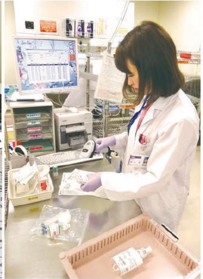
薬剤師による最終監査