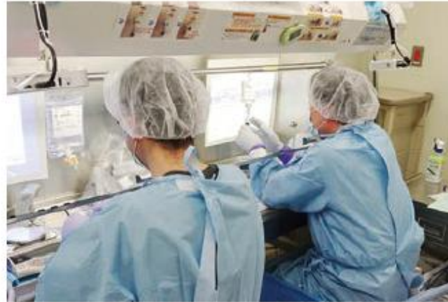
機械化された調製システム

モニター、バーコード、天秤のついた監査システムで、医薬品の照合、採取量の確認・記録等を行いながら、1人で調製作業を行います。別に薬剤師が最終チェックを行い、患者さんに投与されます。