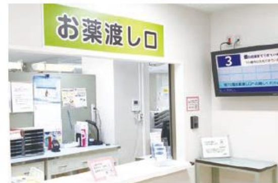
外来棟地下1Fお薬渡し口