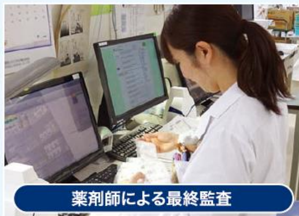
薬剤師による最終監査