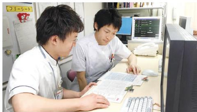
医療スタッフとのカンファレンス