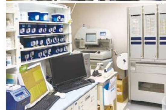
最新機器による調剤支援