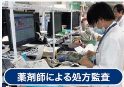
薬剤師による処方監査

調剤・監査は薬剤師の最も重要な仕事の一つです。当院では、薬剤師はチェックシートやカルテを確認しながら処方監査を重点的に行います。薬剤助手やピッキングマシンが医薬品の取り揃えを行い、別の薬剤師が最終監査をするという流れで、調剤を行っています。