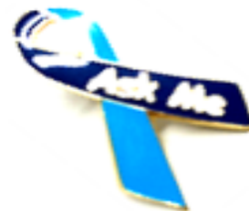
Ask Me! ナースバッジ

言葉や習慣が異なる外国の方も安心して治療が受けられるよう、勤務時間外で英会話講座を開催しています。研修を修了した看護師は、外国人患者さんの対応などを行います。