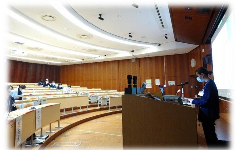
ソーシャルディスタンス・感染防止対策を実施しながら研修をしています