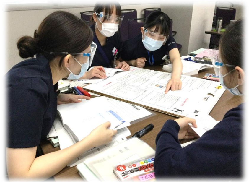
ソーシャルディスタンス・感染防止対策を実施しながら研修をしています

模擬事例を活用して情報収集・情報整理・看護診断のプロセスを展開し標準看護計画立案の思考過程を習得します。