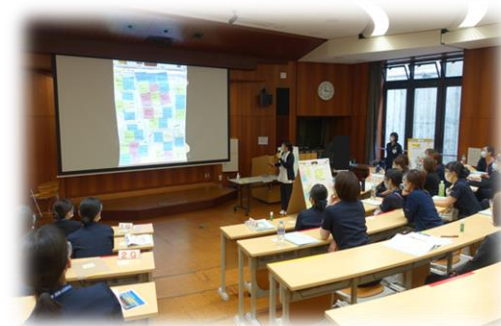
ソーシャルディスタンス・感染防止対策を実施しながら研修をしています

リーダーシップを発揮するために必要な能力を養います。 講義を受講し、グループディスカッションを行います。