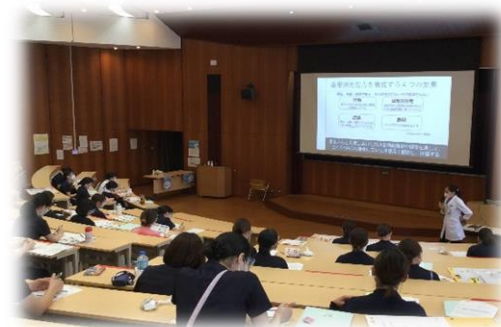
ソーシャルディスタンス・感染防止対策を実施しながら研修をしています

臨床に潜む倫理的問題に気付き、その問題解決について学びます。 講義を受講し、倫理的課題について検討します。