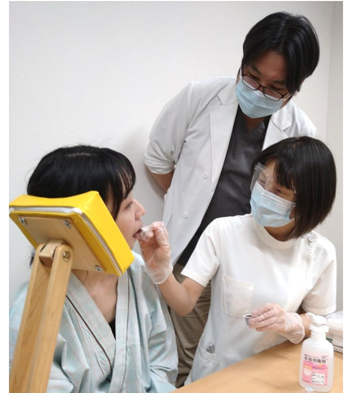
右頬杖嚥下指導中